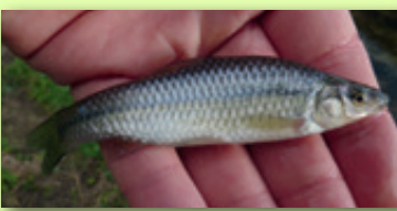
"Goujon asiatique" ou "Pseudorasbora"

Cette espèce est porteur sans d'un agent pathogène susceptible de provoquer, dans certains cas, des mortalités piscicoles très importantes.